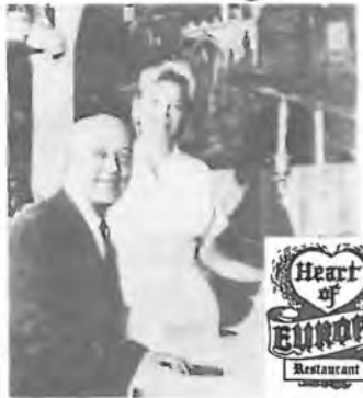
HEART OF EUROPE RESTAURANT