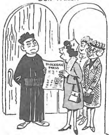
McCormick "It says here that women may now act as lecturers and commentators."