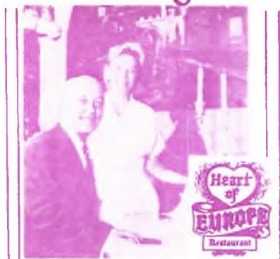
HEART OF EUROPE RESTAURANT