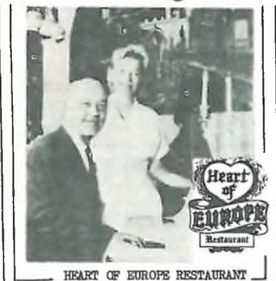
HEART OF EUROPE RESTAURANT