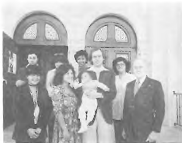
Po křtu před kostelem Christ the King

Řada přátel účastnila se křestního obřadu v kostele Krista Krále, a většina z nich