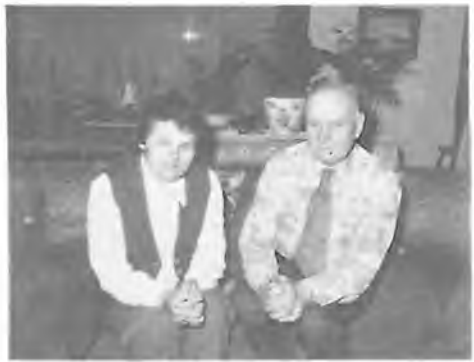
Setkání dvou básníků

nejen českou národnost, ale též katolickou víru, a to za okolností, se kterými se i poměry, do kterých naši čeští pionýři přicházeli zde v Americe, nedají srovnat.