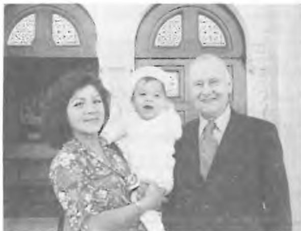
Dědeček s vnučkou a snachou

Křtem se stáváme údem tajemného těla Kristova : Církve, dostáváme nový nadpřirozený život, Boží přítomnost v nás dostává nový podklad, jsme učiněni dědici věčného království. Jsme tak málo uschopnění ocenit tyto velké dary, protože jejich neviditelnost a duchová nadřazenost omezuje naši chápavost. Proto všichni můžeme vděčně vítat symboliku a biblickými texty doprovozenou liturgií nového křestního obřadu. Křest se také koná ve farním kostele rodičů k zdůraznění farní soudržnosti.