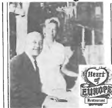
HEART OF EUROPE RESTAURANT