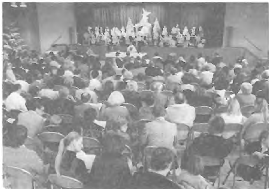
VÁNOČNÍ ČESKÉ BOHOSLUŽBY V AUDITORIU LOVOLA H.S.