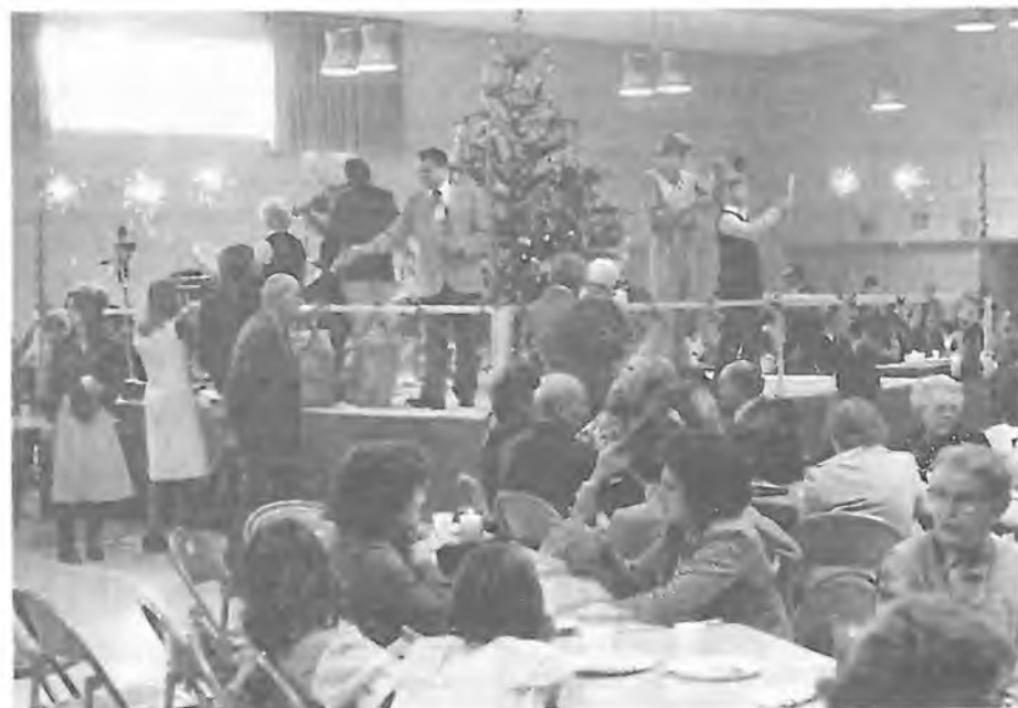
ZPÍVÁNÍ STECKEROVÝCH KOLED U VÁNOČNÍHO STROMU