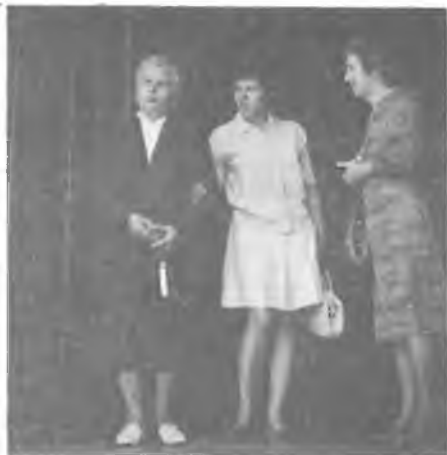
Fotografie z májových bohoslužeb v Loyola High School 14. května 1972.

Rodná stavení vás obou - jak to tenkrát chodilo - připadla starším sourozencům, a tak jste jednoduše odešli "do světa", a usadili se v Rokycanech, odkud bylo do Písku i do Boleslavi přibližně stejně daleko. A protože žádný z vás nemohl trvale žít bez onoho vždy se obnovujícího zázraku klíčení, růstu a zrání, pracovali jste tak dlouho, až se vám do těch Rokycan, kraje ne zvláště příznivého ovocnářství a zelinářství, podařilo - zčásti přeneseně, zčásti doslovně - přenést kousíček onoho zlatého polabského pruhu země české. Založili jste ovocný sad, kterému se ne velikostí, ale tím, co vše v něm rostlo a zráló, široko daleko žádný jiný nevyrovnal. A tam, uprostřed exotických odrůd angreštu a ostružin, jablůnek, které rostly, kvetly i