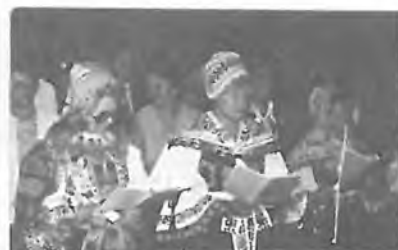
PŘI MŠI SVATÉ V KADI I