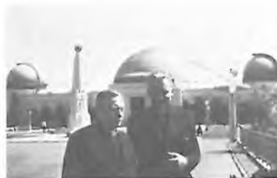
U HVĚZDÁRNY V GRIFFITH PARKU