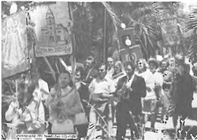
Mariánský průvod konventní zahradou.