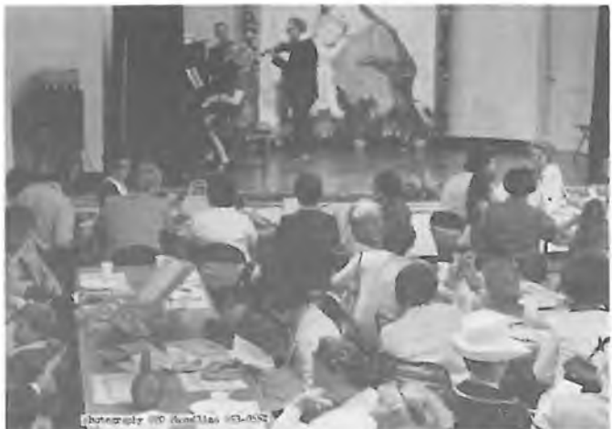
Slavnostní program pro maminky v konventním sálu

2. Svatováclavské bohoslužby budou opět v LOYOLA HIGH SCHOOL.