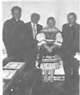
RODINA BROŽKOVÁ S HOSTY