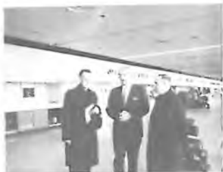
MR. ZAVŘEL VÍTÁ HOSTY NA MEZINÁRODNÍM LETIŠTI