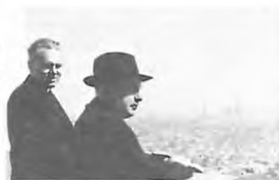
POHLED NA MĚSTO LOS ANGELES