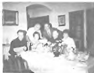
OTEC VOJTĚCH SLAVÍ 50. NAROZENINY PŘI VEČEŘI U BROŽKŮ