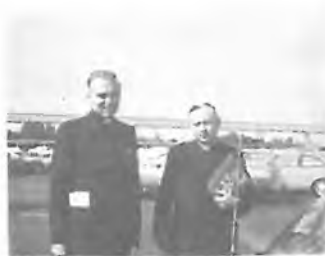
AKLIMATIZACE V DISNEYLANDU