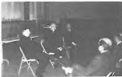
SEZNAMOVACÍ VEČER V SÁLE BLESSED SACRAMENT