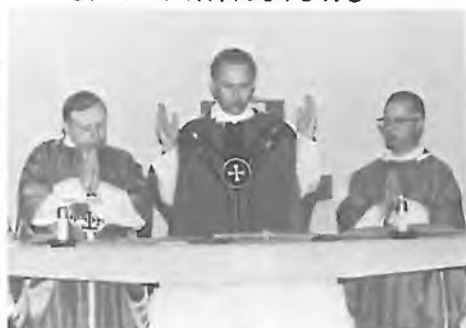
KONCELEBROVANÁ MŠE SVATÁ V KAPLI "HELPERS CONVENT" NA 3300 W. ADAMS BLVD.