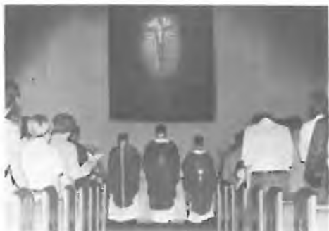
ČESKÉ SLAVNOSTNÍ BOHOSLUŽBY V KAPLI KONVENTU SESTER- POMOCNIC DUŠÍ V OČISTCI.