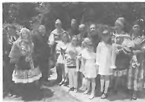
KROJOVANÁ SKUPINA S HOSTMI V KONVENTNÍ ZAHRADĚ U JESKYNĚ PANNY MARIE LURDSKÉ.