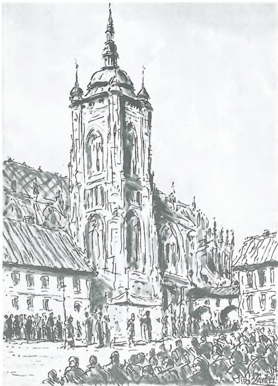
BOŽITĚLOVÝ PRŮVOD U SV. VÍTA V PRAZE