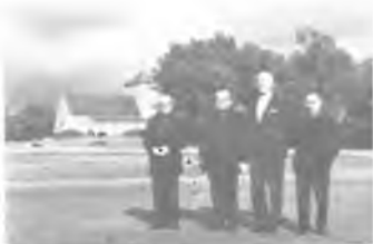
NJDR BISKUP PO PROHLÍDCE NEJVĚTŠÍHO OBRAZU SVĚTA STYKOVA DILA "UKŘÍŽOVÁNÍ".