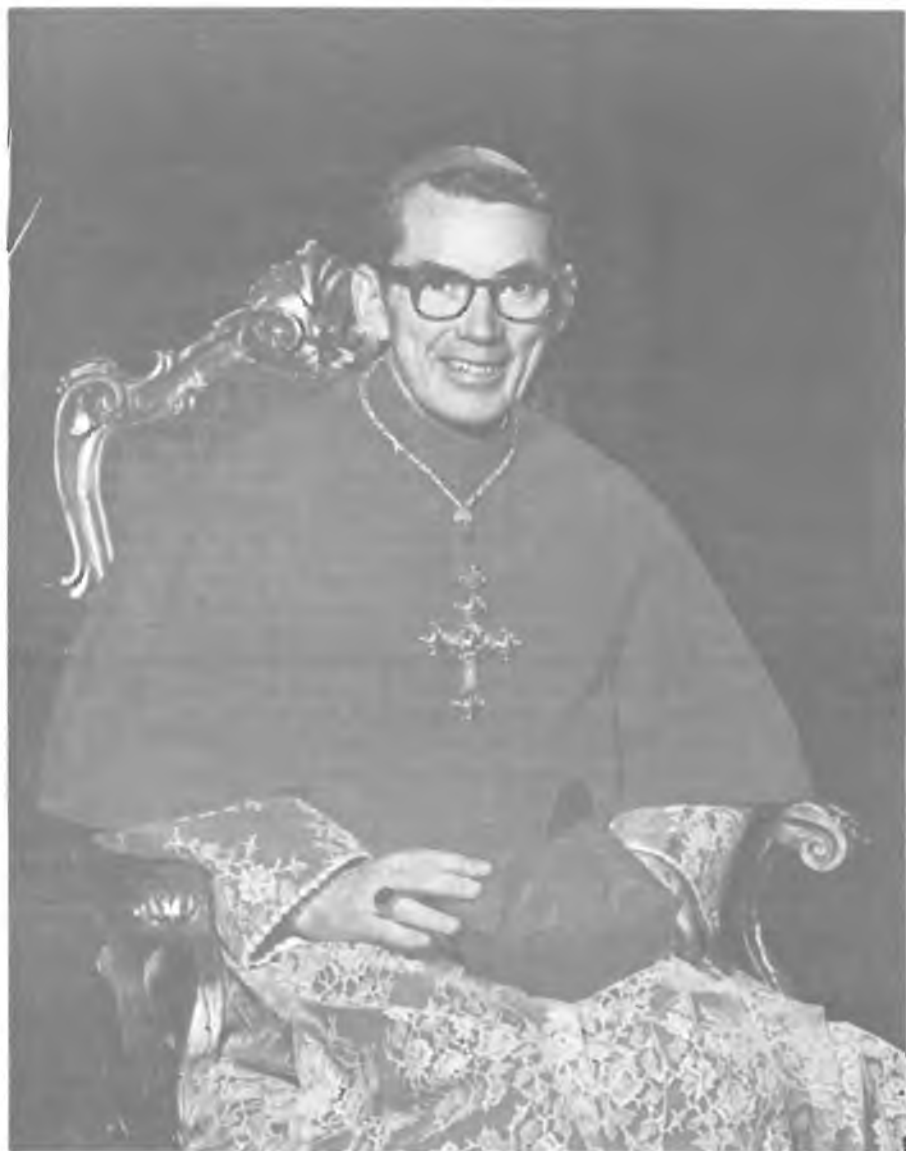
JEHO EMINENCE KARDINÁL TIMOTHY MANNING, KTERÉMU NAŠE MISIE DĚKUJE ZA VŠECHNU PŘÍZEŇ A VYPROŠUJE MU BOŽÍ POŽEHNÁNÍ.