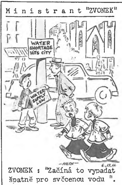
ZVONEK : "Začíná to vypadat špatně pro svčencovu vodu".

Bylo již dříve oznámeno, že kniha má být vrácena příští měsíc nebo musí být prodloužení znovu zaznamenáno v knihovní registraci. Bude jistě na místě, aby pokuta /$1.00 za měsíc/ byla vymáhána.