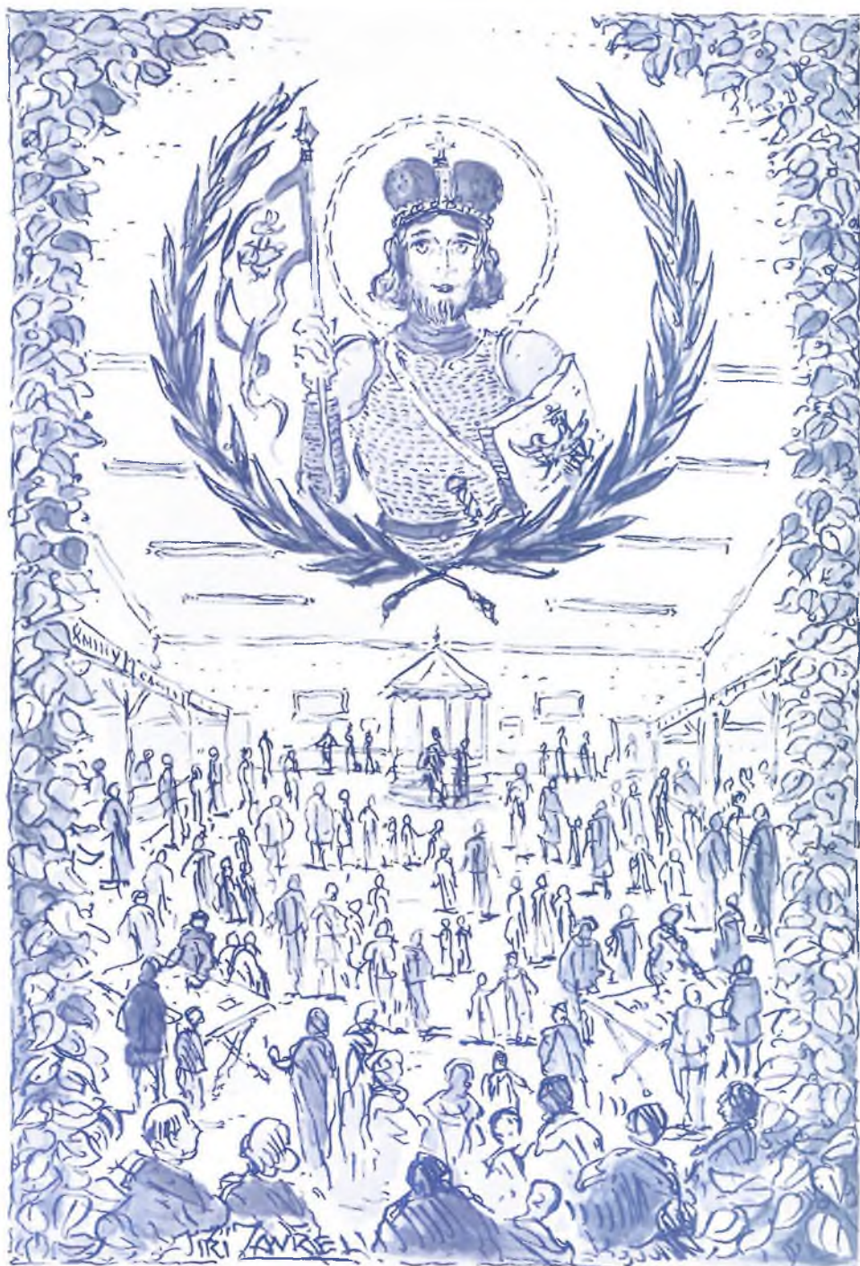
SVATOVÁCLAVSKÁ POUT V LOS ANGELES 1972