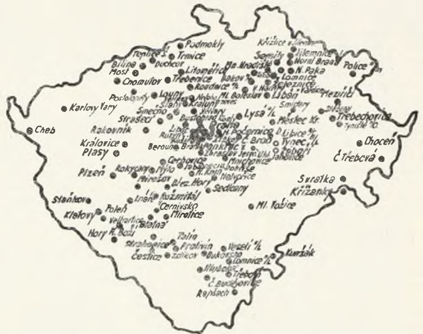
Peněžní a organizační jednotky záložny Hermes. Centrála v Praze I., Masarykovo nábřeží 18.

Záložna Hermes a hraničáři — — Ve zmíněném území bylo velmi těžké budovat hospodářské organizace. České menšiny, rozptýlené v několika politických stranách se hospodářsky nemohly mnoho angažovat, už z toho důvodu, že většina jich není stálými usedlíky, ale státními zaměstnanci, kteří často mění svá působiště. Sběrný záložny Hermes proto nejlépe tomuto kraji vyhovovaly a konaly plně své poslání. Soustřeďují peníze českých katolíků