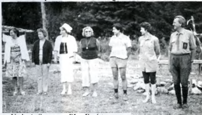
Vedení tábora a rodiče při nástupu Lagerführung und Eltern beim Antreten