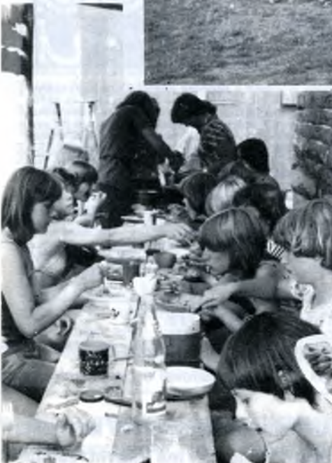
Dobré chutnání – guten Appetit