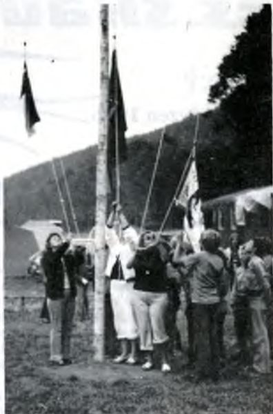
Maminky ze tří zemí při vstýčování vlajek Mütter aus drei verschiedenen Ländern beim Fahnenhissen