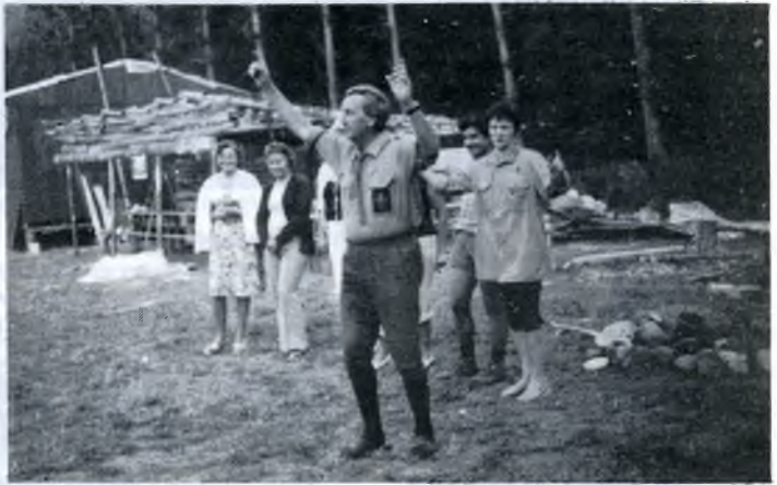
A nyní všichni najednou . . . ! Und jetzt alle zusammen . . . !