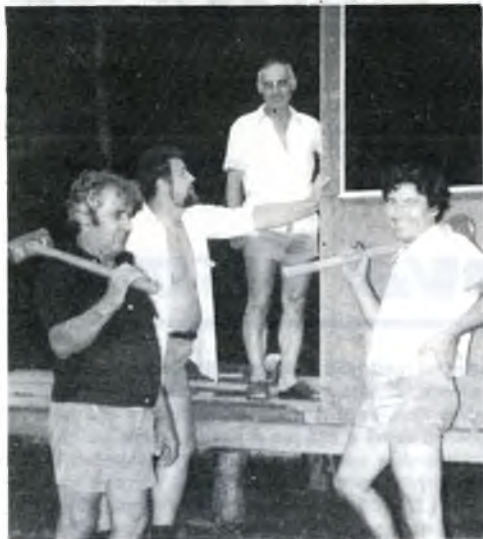
S chutí do stavby naší chaty Mit guter Laune geht's schneller voran