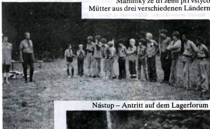
Nástup – Antritt auf dem Lagerforum