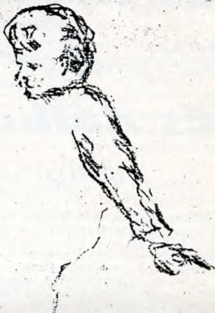
Prof. A.B. Svojsík (6.9.1876–17.9.1938) podle kresby 16-letého skauta, básníka Jiřího Wolkra.