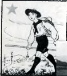
Šlože si do taško výroční omilil ESPERANTO!