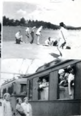
Na skandinávských fjelech a fjordech

K našim obrázkům: 1. Nad Oslofjordem v Storsandau. 2. Vojtech vztahuje naši vlajku. 3. Naše děti zdraví skautským pozdravem a poctu vlajce vzdávají i naše družinové tradiční vlajeky. 4. Holmskolien. 5. Naše děti vysoko nad Oslofjordem v restauraci Holmskolien, kde byly mnohokrát hosty starosty města Oslo. 6. Fy a zábrvy na skalnatém ostrůvku v Valofjord. 7. Fyzionní severští, či turí polární "před-topní zvířata" norské fauny. 8. V táboře na "ofotických ostrovech v průvodu Legoncu. 9. Na sedadle do rychlíku Stuttgart-Hamburgu-Kopenhagen-Oslo. --- Naše soutěž 1/7. a v 9. čísle Skauta-Exulanti jsou uveřejněny na různých stránkách různé skautské oznaky. Napíšte namkterému národu, který patří, kdo posle do 10. listopadu správnou odpověď, dostane za odměnu pěknou knížku. Naše příští číslo vyjde jako dvojčíslo 11/12 a redakční uzavěrka je 1. listopadu. Pro 1. číslo nového 24. ročníku 1975 chystáme barevnou obálku. Pošlete své návrhy, kresby a foto adresa redakce: Stuttgart, Postfach 1134, nebo CH 8180 Bulach /24, Frohaldenstr. 41