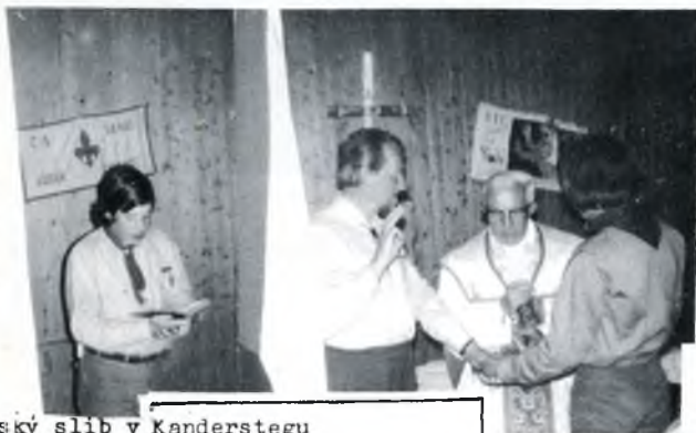
Skautský slib v Kanderstegu