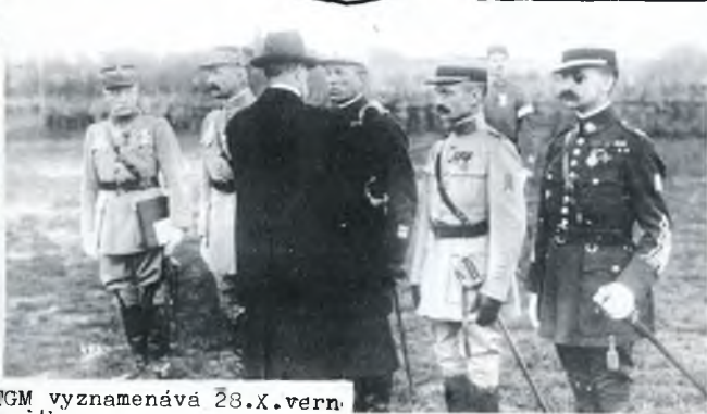
TGM vyznamenává 28. X. věrné vojáky.