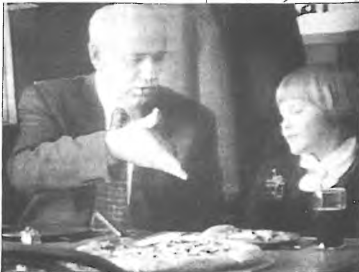
MICHAIL GORBAČOV NABÍZÍ v televizní reklamě své vnučce horoucí pizzu. Chce tímto způsobem pro svou nadaci získat chybějící peníze.

kterého premiér Klaus před časem používal jako svého neschopnějšího muže na řešení nejožehavějších krizí, svědčí o ztrátě elánu i důvěry v to, že současná koaliční vláda je s to různé nesnáze řešit. Na průvod padlých ministrů je smutná podívaná, která svědčí o tom, že radikální změny ve vládě anebo její konec jsou za dveřmi.