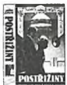
kód V5000/299 - Kč Postřižiny (video)