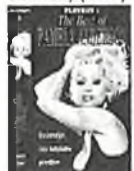
kód V0312/299 - Kč Best P. Anderson (video)