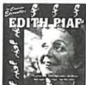
kód 3888012 Edith Piaf