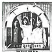
kód 1021.2022-2 The Bee Gees