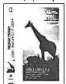
kód D0535/240 - Kč Africká divočina (video)