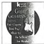
kód 1621.1028-2 Great Guitarists