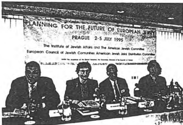
Ze zahájení konference v hotelu Evrum

Je těžké vybírat z desítek projevů a diskusních příspěvků ty, které by byly pro mezinárodní setkání typické a zobecňující. Uvedme alespoň dva pohledy - východoevropský a západoevropský, jež zaujaly hosta žijícího v srdci kontinentu, který své židovské populaci stále ukazoval tu nejošklivější tvář.