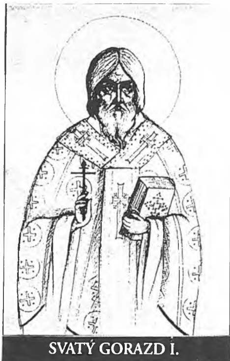
SVATÝ GORAZD I.