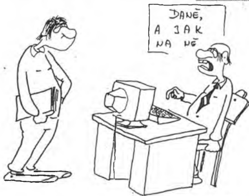
To si trochu pletete, pane kolego. DPH znamená daň z přidané hodnoty a nikoliv dát Pilipovi houby.