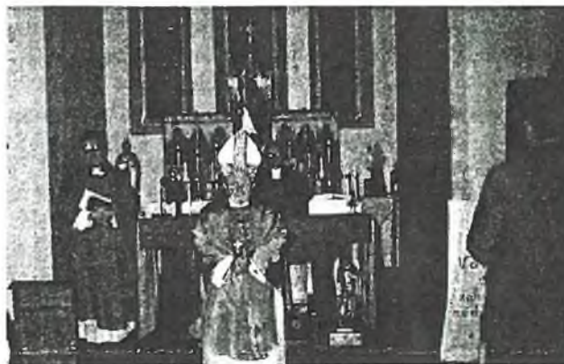
18. 10. 1997 - kostel sv. Vojtěcha v Burlington, Ontario, Kanada