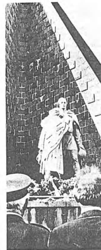
Dukla - místo krvavých bojů naši i sovětské armády. Společný hrob mnoha našich krajanů, kteří zde spí svůj věčný sen po splnění povinnosti vůči svému národu, vůči své staré vlasti. Čest jejich památce!