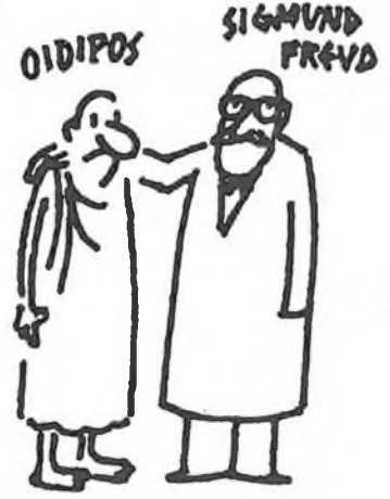
Kresba V. Jiráčka (Čtení o antice 1982—83)

"Malá Vídeň" jak bylo nazýváno město Šumperk za starého Rakouska se za 100 let nezměnilo, v tomto pohledu je patrný kypící život minulého století a socialistická sterilita vyprázdněného života v totalitní společnosti. VH.