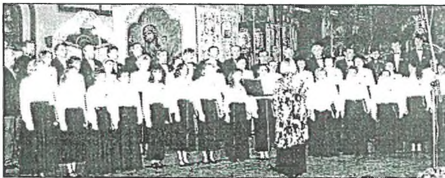
Mládežnický sbor souboru sv. Trojice v Hajnowce

Dne 13. 7. 1996 se hosté zúčastnili pietního aktu v Novém Malíně, kde dopoledne krásným zpěvem a důstojným projevem obohatili bohoslužby, které sloužil biskup Kryštof a několik duchovních, u památníku věnovanému obětem českého Malína na Ukrajině ve druhé světové válce. Odpoledne pokračovalo setkání všech účastníků v místní sokolovně, kde polský pěvecký sbor přispěl také kulturním vystoupením a zazpíval několik polských, běloruských a ukrajinských písní. Jejich vystoupení se setkala s velkým ohlasem všech přítomných a sklídilo potlesk a pochvalné uznání.