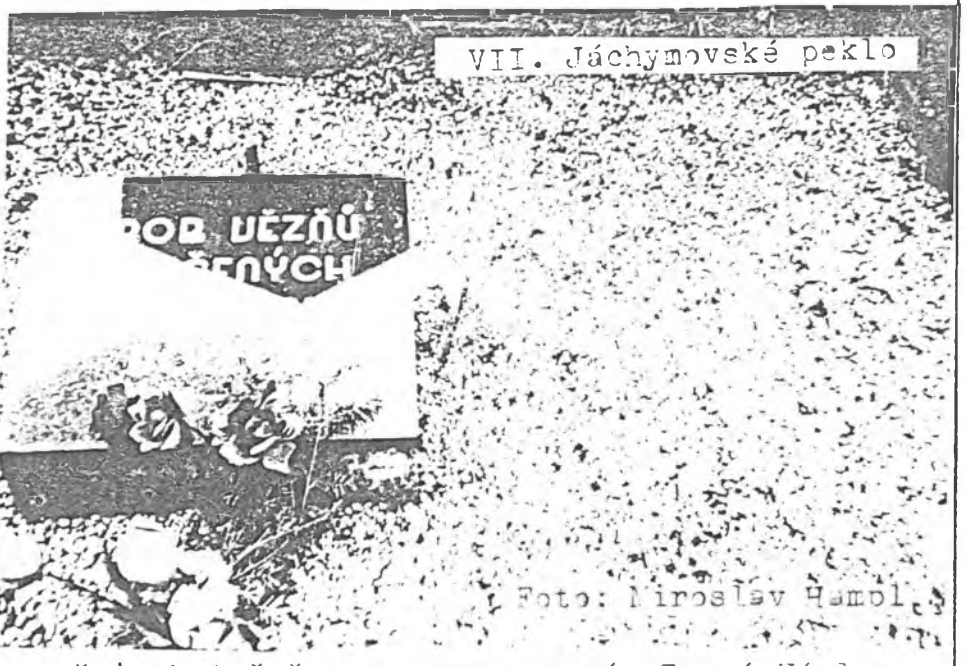
VII. Jáchymovské peklo

Někteří lidé mi říkají, že se často obávají, že stále omílám restituce, rehabilitace a pod. Je to pravda, ale jsou to problémy, které zůstaly nevyřešeny ani tou tzv. pravicovou vládou. Cesta