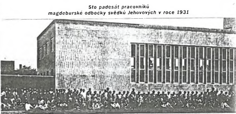
Sto padesát pracovníků magdebské odbočky svědků Jehovových v roce 1931

Přes zjevně nepřátelský postoj Hitlerova režimu uspořádali svědkové Jehovovi 25. června 1933 v Berlíně sjezd. Sešlo se asi 7000 lidí. Svědkové jasně a veřejně oznámili své cíle: „Naše organizace není v žád-