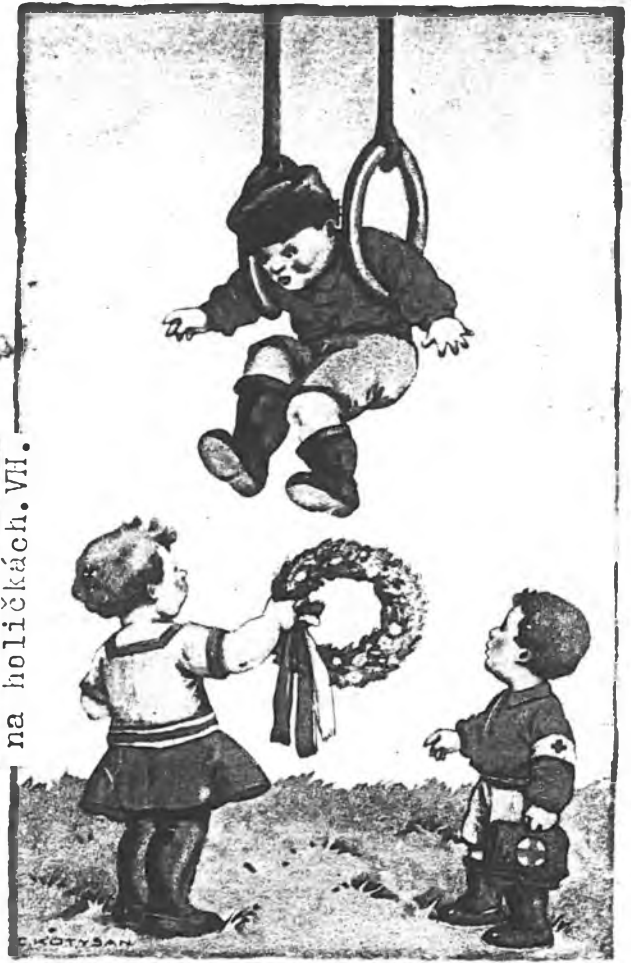
Šelha křiž. Sokolů slet!