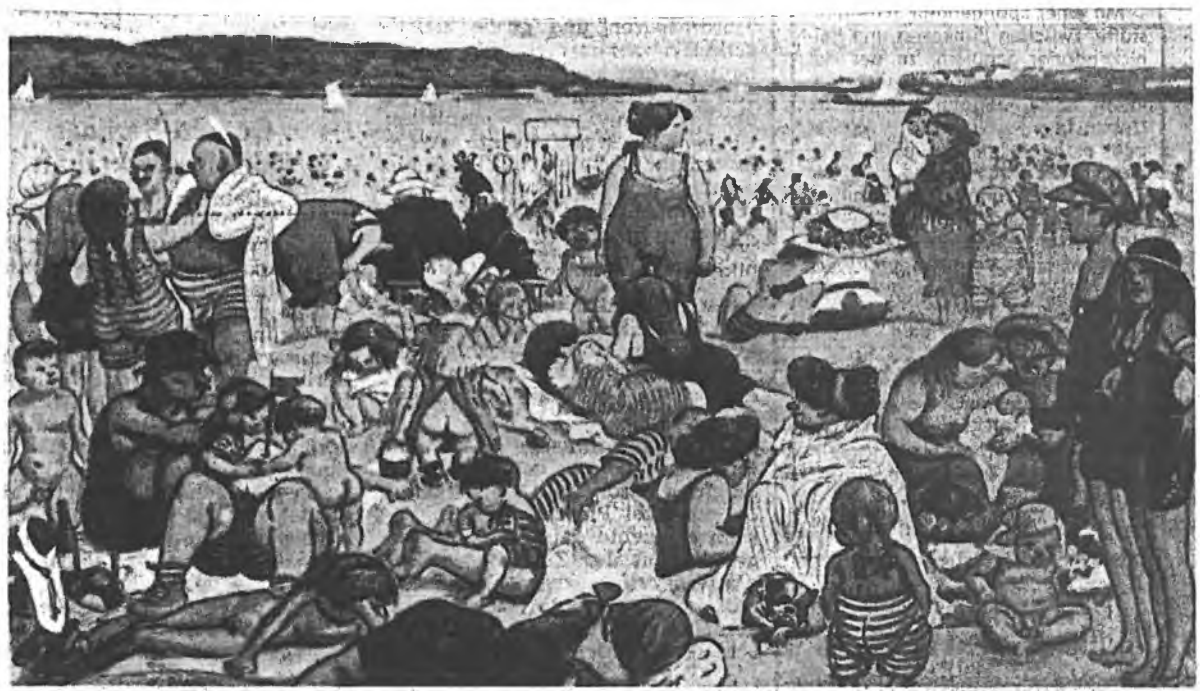
Müggelsee heute, fret nach Zille. Pärchen rechts: „Wer is'n hier Wesst oder Ossi, Charly?“ - „Is doch völlich ejal. Die pinkeln alle ohne Jeld in den See.“