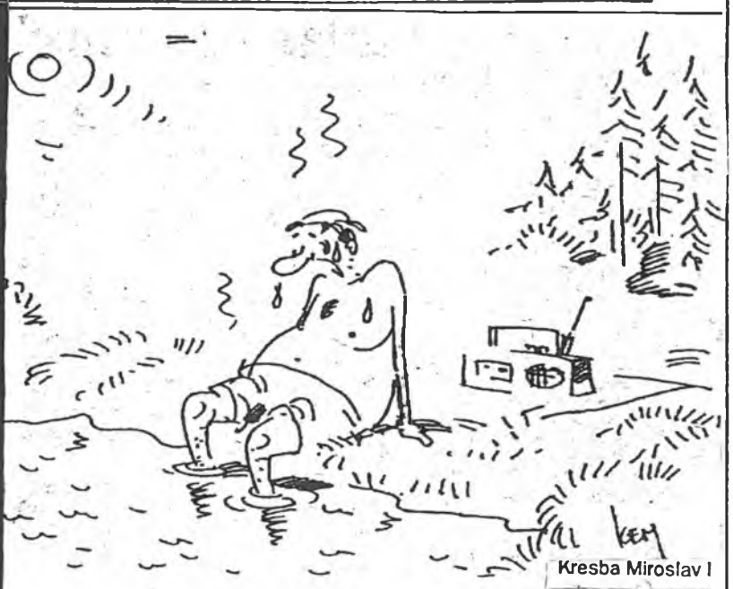
Kresba Miroslav I

1. Řez přináší pohled na optická vlákna a běžný kabel. Dva svazky optických vláken dokážou přenést víc telefonních hovorů než měděný kabel tlustý jako zápěstí. 2. Pozoruhodným nástrojem revoluce v přenosu informací jsou optická vlákna, svazek vláken ze skla nebo plastu, tenkých a ohebných jako lidský vlas. Tato vlákna přenášejí slaboučké impulsy nebo záblesky laserových paprsků s frekvencí stovek miliónů impulsů za vteřinu. Během jedné sekundy dokáže vláknová optika přenést písmeno za písmenem obsah 200 knih nebo zprostředkovat současně 10 tisíc telefonních hovorů či vyslat za zlomek vteřiny obrovské množství pokynů třeba pro chod továrny. 3. Propojení počítačů nesmírně urychlilo rezervaci hotelových pokojů a půjčování aut. Zaměstnanci leteckých společností po celé zemi jsou v přímém styku a objednat lístky do divadla, potvrdit objednávku a vytisknout vstu-