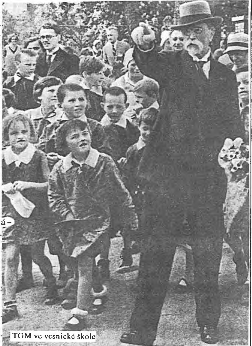
TGM ve vesnické škole

Dle výroku Ústavního soudu o zrušení podmínky trvalého pobytu trošku zřinčil fakt druhotné konfiskace, dnes už demokratickým popřevratovým režimem možnosti emigrantů ve znovuzískání komunisty ukradeného majetku. Tento postoj sametového režimu již tolik nekoresponduje ve vztahu tohoto režimu k emigraci a ke všem těm, kteří v ní snili o tom, že konec vlády totalitního režimu bude i počátkem spravedlivého odčinění křivd spáchaných totalitním komunistickým režimem. Vztah k emigraci krystalizoval od začátku velmi negativně a dodnes se současní mocipáni nejsou schopni s tímto vyrovnat. Hrozbou pro ně od začátku byla notoricky známá skutečnost, že všichni nejvýznamější státníci v novém československém státě působili v emigraci - TGM, Milan Rastislav Štefánik i Eduard Beneš. Voliči se tímto precedensem nemohli ani řídit, neboť jim to vláda pre-