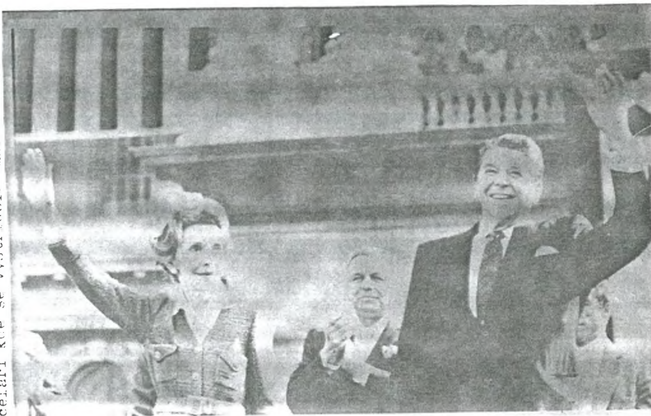
Presidentti Ronald Reagan ja hänen vaimonsa Nancy hurskuttavat valtionvarmolna tilistaina Sacramentoissa, Kaliforniassa. Heidän vaimo Nancy hurskuttavat valtionvarmolna tilistaina Sacramentoissa, Kaliforniassa. Heidän vaimo Nancy hurskuttavat valtionvarmolna tilistaina Sacramentoissa, Kaliforniassa.