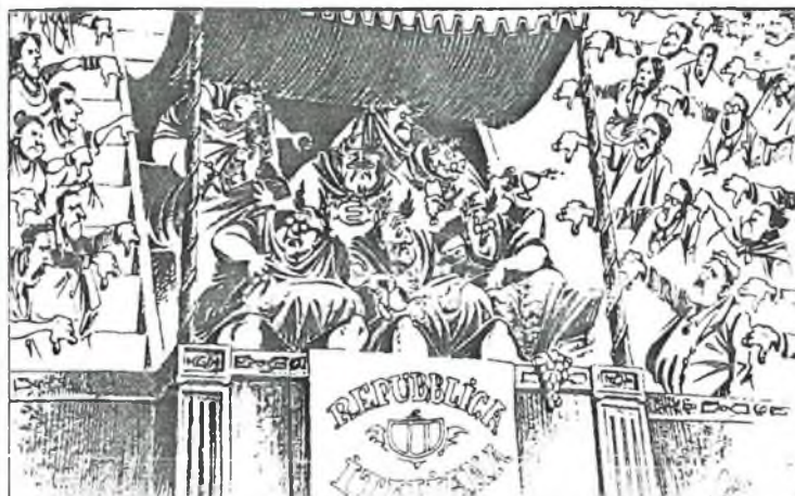
From Lausanne, Switzerland. By CHAPPATTE.