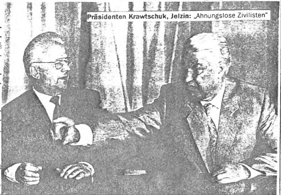
Präsidenten Krawtschuk, Jelzin: „Ahnungslose Zivilisten“

"Dnes jste už zase takhle maličký" říká možná Jelcin ukrajinskému prezidentovi, bývalému ideologickému tajemníkovi Leonida Iljiče, který s přehledem zvítězil ve svobodných volbách. Konec konců, každý má takovou vládu jakou si zaslouží.