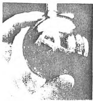
Nejeden vánoční stromek v USA zdobily skleněné koule se šípem a kladivem. Podle zprávy DPA jedná čs. firmu exportovala do Spojených států na 6.000 těchto ozdób.