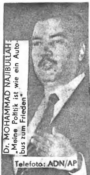
Dr. MOHAMMAD NAJIBULLAH. "Meine Politik ist wie ein Auto-bus zum Frieden"