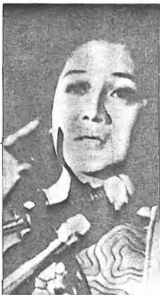
Kenia on jo ihan tarpeksi, mutta mistä ostais lisää koruja, sun-deerna Imelda Marcos.

Bez této Reaganově pomoci komunistům, by tato zrádná rudá společnost, byla dávno odsouzena k zániku a demokratická část národa, nemusela by shánět grošiky k boji proti křtům našeho domova.