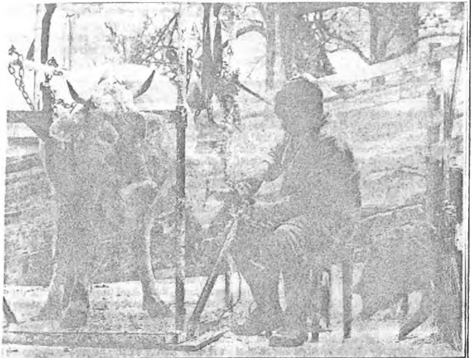
JARNÍ PRÁCE a údržba se nevyhýbají ani dobytku. Švýcařští chovatelé, kteří si dříve na ošetřování krav najímali odborníky, dnes již tuto práci zvládají většinou sami.

málo kdo si dnes nametuje, že Švýcaři ovli za I. rep. najínání našimi většými sedláky k dobytku. Jak hluboko jsme museli klesnout, když se nám tento fakt dnes zdá jako sen. Překvapí to i odborníky ze ZN, odkud je tento