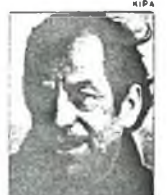
V. Havel (né en 1936).