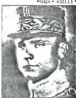
M. Stefanik (1880-1919).

1918. La défaite militaire de l'Autriche-Hongrie, dont les Tchèques et les Slovaques faisaient partie sans jamais avoir été unis, provoque la création, à l'initiative du Tchèque Masaryk et du Slovaque Stefanik, de la Tchécoslovaquie (28 octobre 1918). Ses frontières sont consacrées par le traité de Trianon (4 juin 1920). 1938. Cette démocratie exemplaire va céder sous une double pression : à l'extérieur, celle de l'Allemagne hitlérienne, qui fait accepter le dépeçage du pays à Munich (1938), avant d'envahir la Bohême-Moravie (1939) ; et, à l'intérieur, celle du nationalisme slovaque, incarné par Mgr Jozef Tiso, auquel Hitler accorde alors l'indépendance de la Slovaquie.