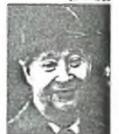
A. Dubcek (1921-1992).

1989. Il faudra la chute du mur de Berlin et le double engagement de la Charte 77 (Vaclav Havel) et de l'Eglise catholique (Mgr Tomasek) pour que la « révolution de velours » renverse le régime (novembre 1989) et déclenche le processus de séparation pacifique du pays.