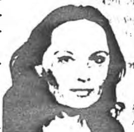
Viktorie Hradská místopředsedkyně vládního výboru ČR pro zahraniční vztahy

Narozen 1940 v Praze. Absolvent filosofické fakulty UK. Redaktor, literární kritik. Po roce 1968 pracoval jako montér, později programátor. Signatář Charty 77, zakládající účastník Demokratické iniciativy. Poslancem FS od ledna 1990, člen zahraničního výboru FS.