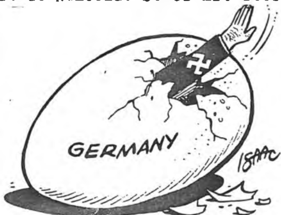
Zeichnung: Isaac, Bulletin Today (Manila), CAW Syndicate

Chci-li se podívat do tváře této provenience, nemusím jezdit do Německa. Stačí mít štěstí v metru a jste svědky ob-