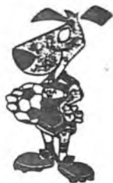
Maskot MS '94

Není na světě sportovního periodika (včetně Fotbal PRESSu), jež by neotisklo podobiznu maskota příštího MS'94 v USA „World Cup'94“.