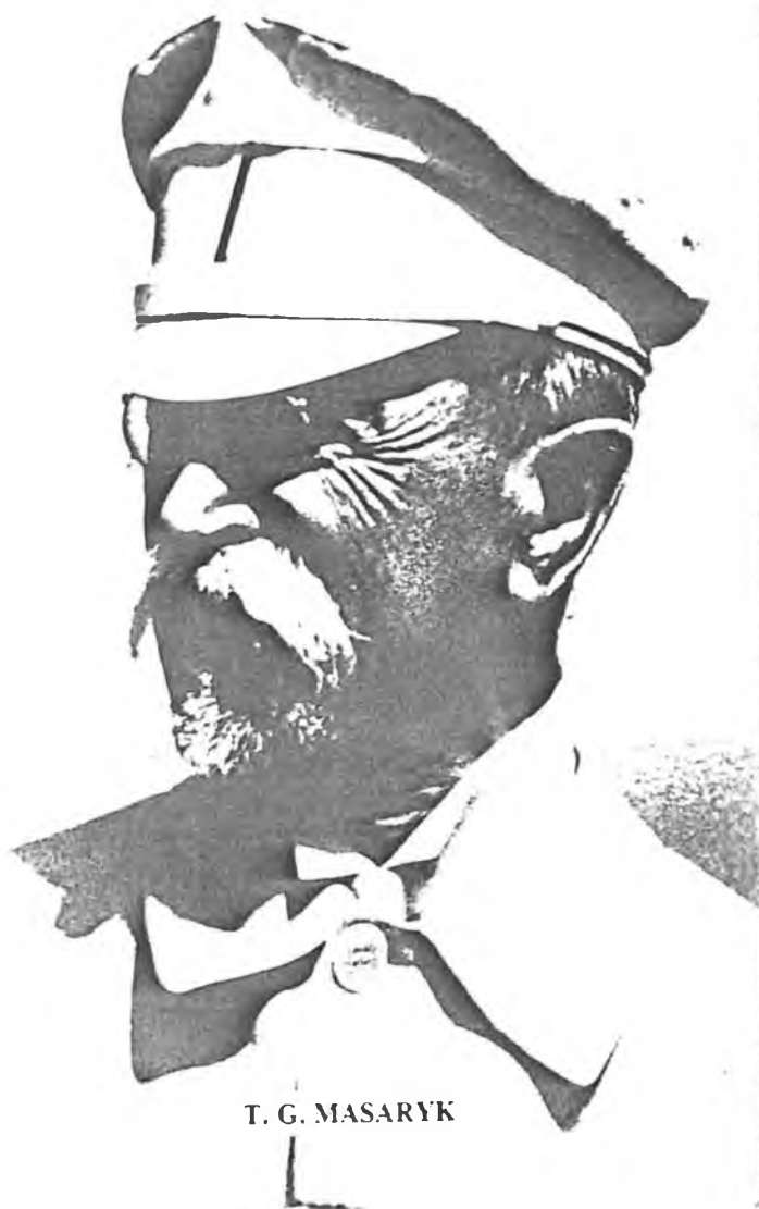
T. G. MASARYK