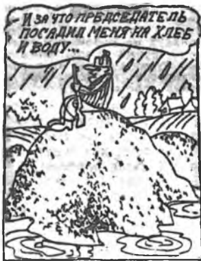
Рис. Е. ВАСИЛЬЕВА.

duchovní problematika vězeňství potřeba dialogu ve společnosti výchova k lidským právům kluby Charty 77 sociální problematika česko-slovenská vzájemnost právní připomínky příprava časopisu Charty 77