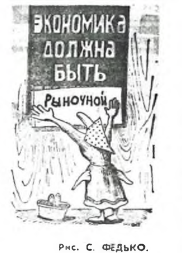
Рис. С. ФЕДЬКО.