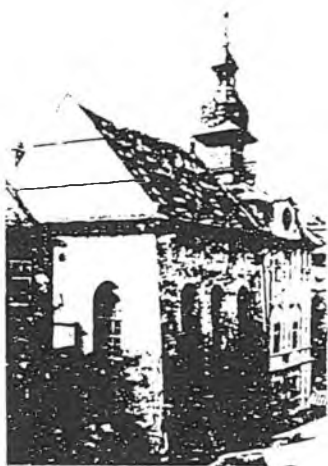
Vysoká synagoga a radnice ze severovýchodu, kolem r.1900.

Jako Židovka podle halachy jsem se nemusela cítit osobně dotčena; nicméně mi to procentově počítání připadalo zvrácené. Ti mladí tenkrát vlastně vycházeli z definice norimberských zákonů, kterou pouze