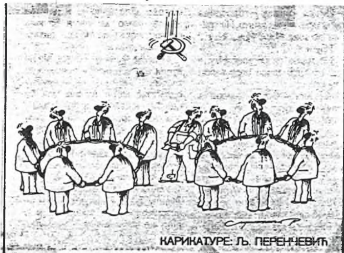
"Res publica" č.15/92