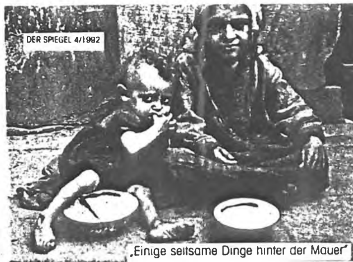
Bettelnde Kinder im Warschauer Ghetto