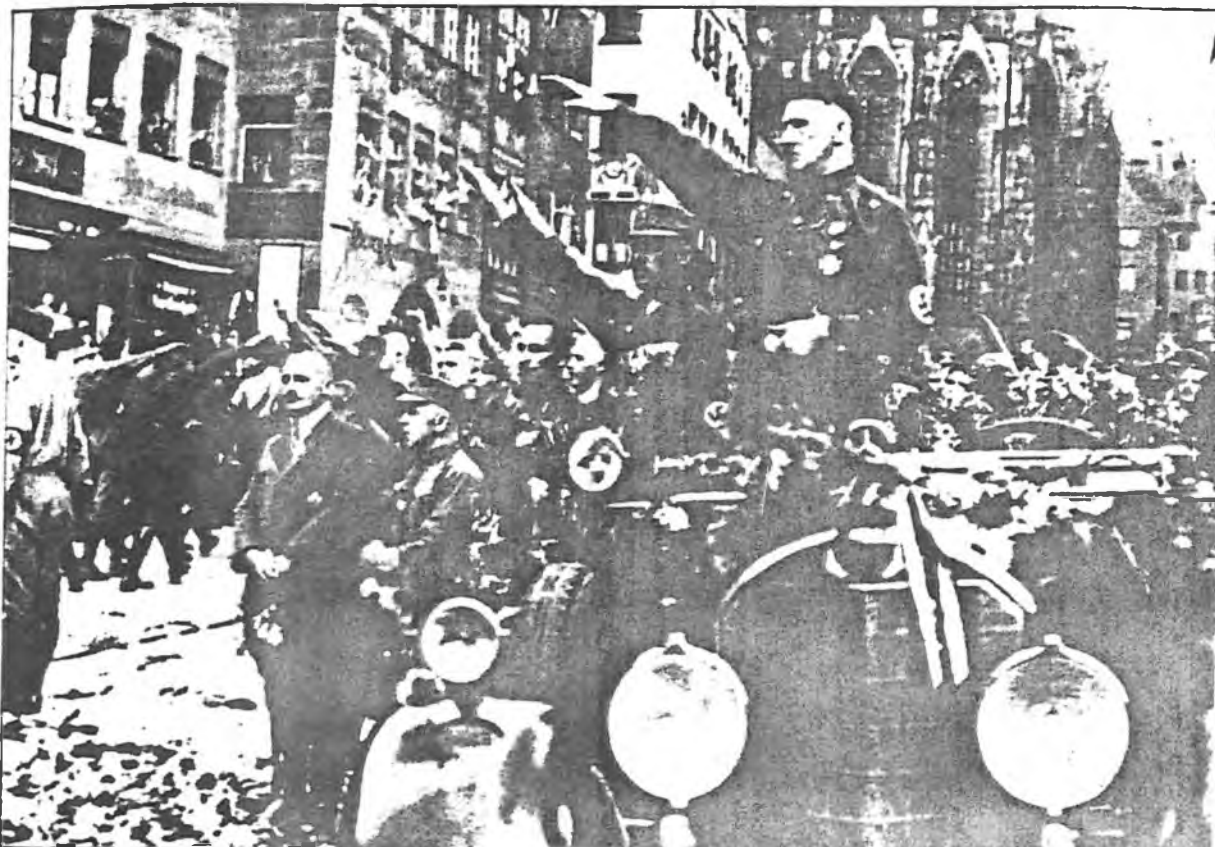
Primera manifestación del partido después de la salida de Hitler de la cárcel en 1927: la democracia alemana tiene sus días.

První stranická manifestace NSDAP v r.1927 znamenala bezprostřední ohrožení demokracie. Tehdy ji slávu provolávali jen skuteční nacisti. Po několika letech to byla už většina obyvatelstva. A ještě později se s větší či menší chutí do těchto parádemaršů nechale zavléci i naše německé obyvatelstvo. O to víc jsme dlužni těm Němcům, kteří se tomu nepropůjčili. V.H.