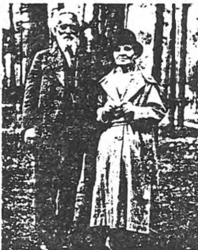
Simon Dubnov se ženou (Berlin 1920)

Židé jsou národ, jehož domovem je celý svět (Elie Wiesel). Na židovské náboženství pohlížel jako na součást židovské národnosti a projev sebeobrany a disciplíny národa, obklopeného nejprve pohany, později křesťany. Vytvoření novodobého židovského státu pokládal za "pseudomesiášské dobrodružství". Dubnov věřil, že nejsilnějším židovským centrem v moderní době bude středisko rusko-polské s jazykem jidiš a že Židé budou patřit k národům, které v rámci "národnostního státu" - Ruské a Rakousko-uherské říše - budou moci bez zábran rozvíjet svou svěbytnost.