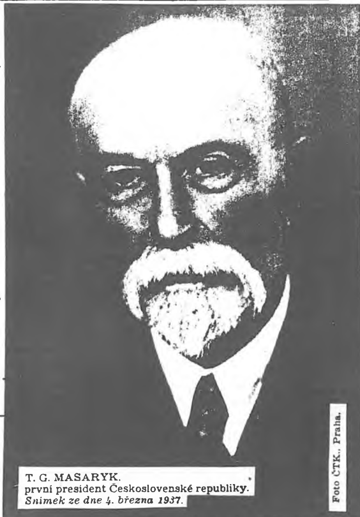
T. G. MASARYK. první prezident Československé republiky. Snímek ze dne 4. března 1937.

14.září 1937 umírá v Lánech TGM a znovu jako již mnohokrát si musíme připomenout jeho neohroženost tváří tvář vybičovanému antisemitismu v r. 1899 v souvislosti s t.zv. Hilsnerovou aférou. Tuto vlastnost postavit se většině jež zastává mylný názor u něho obdivujeme vícekrát. Jestliže v ideji čechoslovakismu se mýlil, jestliže některé policejní zákroky za jeho vlády byly příliš kruté, jestliže ještě za svého života se nechal oslavovat řekněme na hranicích vkusu, jestliže se nechal zvo-